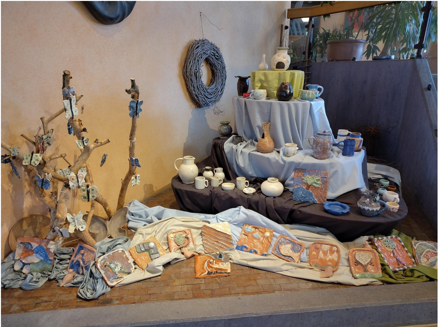
Aus der Töpferwerkstatt