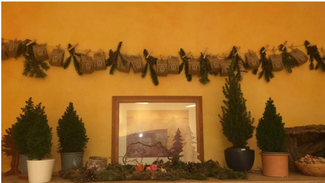
Impressionen aus Klasse 3